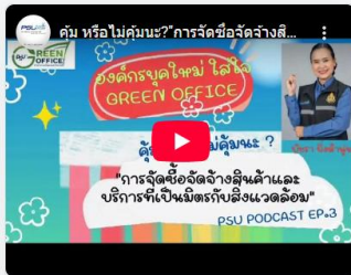
26 กันยายน 2568 คุณ หรือไม่คุณนะ? การจัดซื้อจัดจ้างสินค้าและบริการที่เป็นมิตรกับสิ่งแวดล้อม