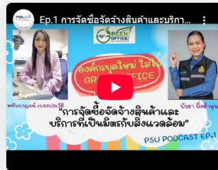
26 กันยายน 2568 Ep.1 การจัดซื้อจัดจ้างสินค้าและบริการที่เป็นมิตรกับสิ่งแวดล้อม