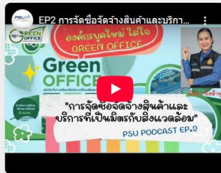
26 กันยายน 2568 EP2 การจัดซื้อจัดจ้างสินค้าและบริการที่เป็นมิตรกับสิ่งแวดล้อม